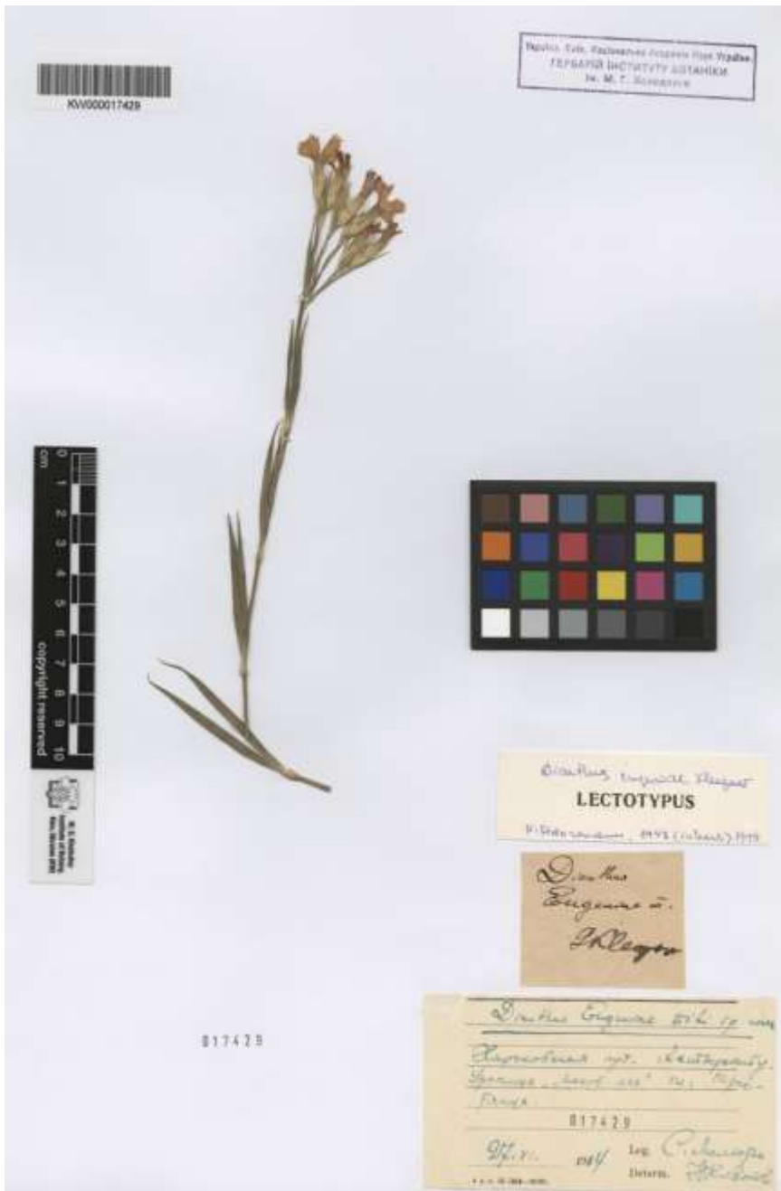
Lectotypus Dianthus eugenii Kleopow