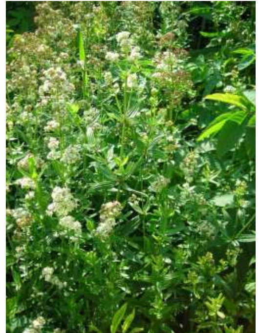
Galium × pseudorubioides Klokov

На підставі її гербарних матеріалів українськими ботаніками були описані нові для науки види судинних рослин, зокрема два названі на її честь, – Dianthus eugenii Kleopow та Silene eugeniae Kleopow, а також Galium × pseudorubioides Klokov.