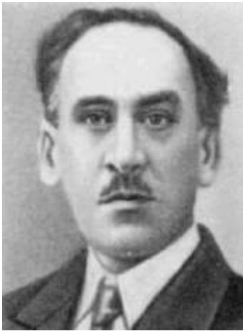
Академік АН УРСР О.В. Фомін, фундатор Ботанічного кабінету ВУАН та Інституту ботаніки АН УРСР

Наукову працю Є.Т. Полонська розпочала у 1926 р. старшим лаборантом Ботанічного музею та Гербарію ВУАН (попередника Інституту ботаніки ім. М.Г.Холодного НАН України).