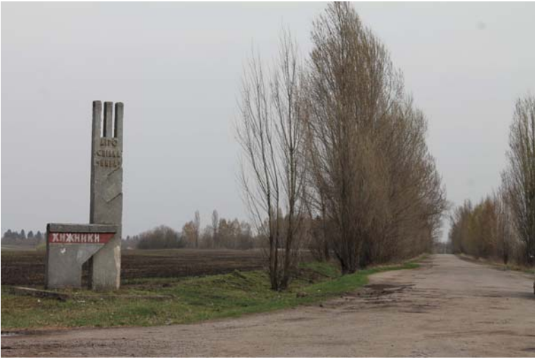
Фото 1. В'їзд в село Хижники (Хмельницька обл.). 2016 р.