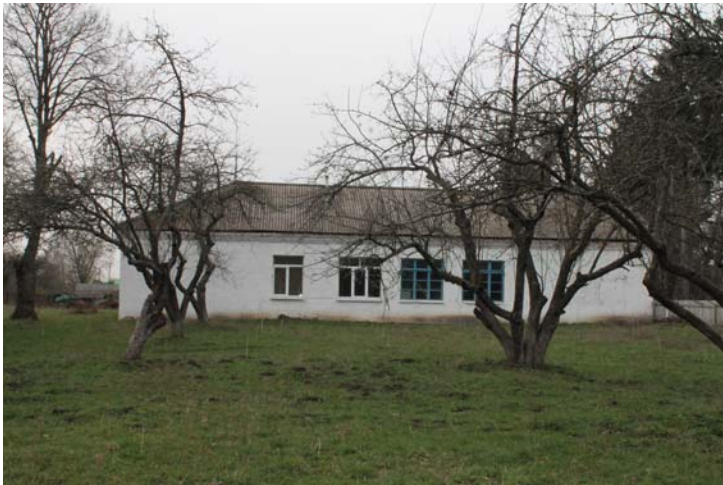
Фото 4. Хижницька школа, в якій навчалася Д.М. Доброчаєва. 2016 р.