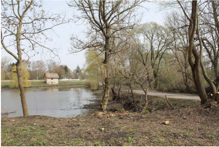
Фото 3. Село Хижники, Романів кут, ставки. 2016 р.