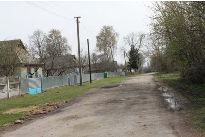
Фото 2. Село Хижники, Романів кут . 2016 р.