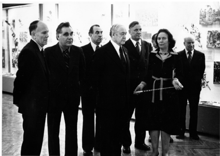
Фото 19. У ботанічному музеї Інституту ботаніки ім. М.Г. Холодного АН УРСР (зліва направо у першому ряду): Б.Є. Патон, К.М. Ситник, Є.П. Вєліхов, Д.М. Доброчаєва. 80-ті роки ХХ ст.